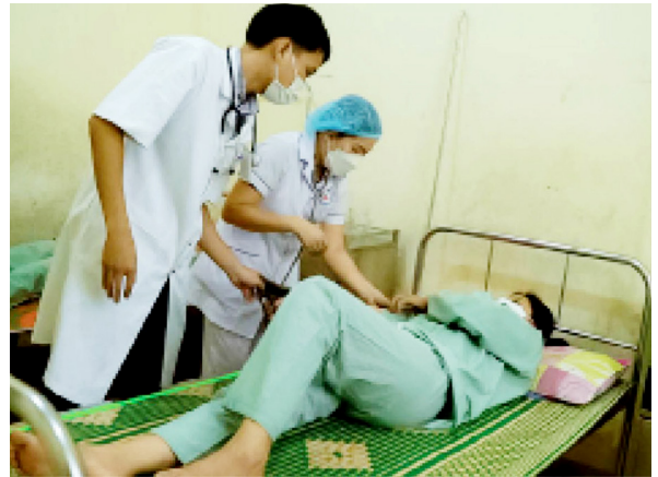
Các TTYT tuyển huyện đang thiếu bác sĩ đa khoa (Trong ảnh, điều trị cho bệnh nhân nội trú tại Trung tâm Y tế Quảng Điền)