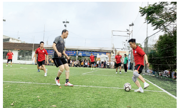
Một số hình ảnh thi đấu bóng đá và cầu lông