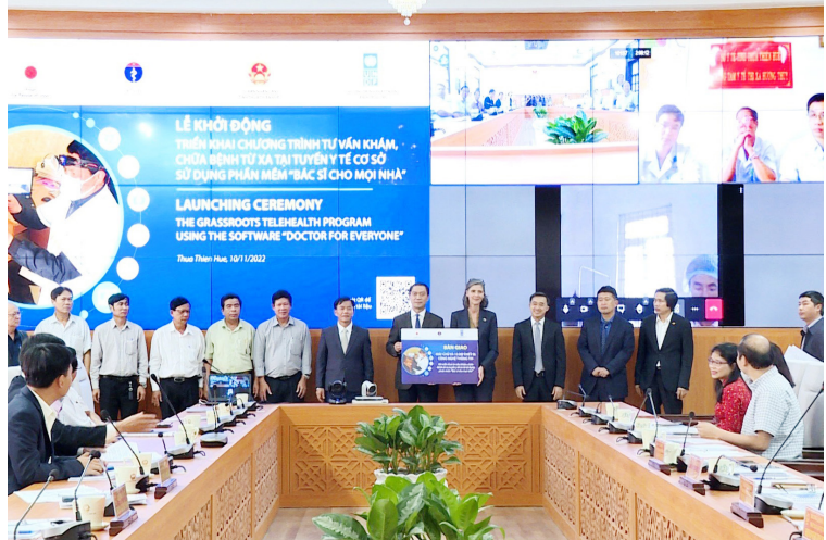
Lễ khởi động chương trình tư vấn khám, chữa bệnh từ xa tại tuyến y tế cơ sở dụng phần mềm "Bác sĩ cho mọi nhà"

Ngày 09/8/2021, Hội nghị lần thứ tư Ban Chấp hành Đảng bộ tỉnh Khóa XVI đã ban hành Nghị quyết số 08-NQ/TU về xây dựng Thừa Thiên Huế xứng tầm là một trong những trung tâm y tế chuyên sâu của khu vực Đông Nam Á giai đoạn 2021 - 2025 và tầm nhìn đến năm 2030. Với mục tiêu giai đoạn 2021 - 2025, tầm nhìn đến năm 2030, xây dựng, phát triển Thừa Thiên Huế trở