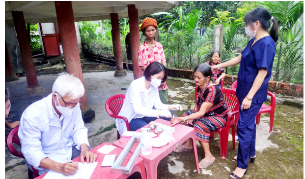
Các y bác sĩ Trung tâm Kiểm soát bệnh tật tỉnh xét nghiệm máu tìm ký sinh trùng sốt rét cho người dân tại huyện A Lưới

Từ ngày tốt nghiệp ra trường ở Trường Đại học Y khoa Huế, tôi được vinh dự phục vụ chuyên ngành phòng chống bệnh sốt rét, các bệnh ký sinh trùng và côn trùng truyền bệnh của khu vực miền Trung - Tây Nguyên tại Viện Sốt rét - Ký sinh trùng - Côn trùng Quy Nhơn; sau đó do hoàn cảnh gia đình được chuyển về công tác tại Trạm Sốt rét tỉnh Bình Trị Thiên, rồi Trung tâm Phòng chống Sốt rét - Ký sinh trùng - Côn trùng tỉnh Thừa Thiên Huế cho đến khi nghỉ hưu. Sau 34 năm thực hiện nhiệm vụ, trước khi nghỉ công tác tôi đã tâm sự với các đồng nghiệp và đồng đội là thời gian tiếp theo không biết tôi có còn đủ sức khỏe, có còn hiện diện trên cõi đời này để thấy được quê hương mình được công nhận loại trừ bệnh sốt rét. Thực tế với sự nỗ lực cố gắng phấn đấu thực hiện nhiệm vụ theo chiến lược phòng chống và loại trừ bệnh sốt rét của nhiều địa phương; đến năm 2021 đã có 36 tỉnh, thành phố đạt các tiêu chí loại trừ bệnh sốt rét theo quy định; qua năm 2022 có thêm 6 địa phương nữa được công nhận. Như vậy đến nay cả nước có 42 tỉnh, thành phố