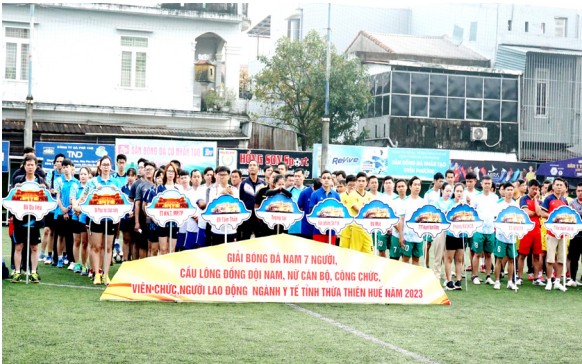
Lễ khai mạc giải bóng đá và cầu lông đồng đội nam, nữ