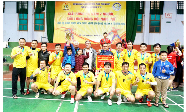
Liên quân Bệnh viện Mắt Huế và Bệnh viện chấn thương chỉnh hình: Giải nhất bóng đá nam.