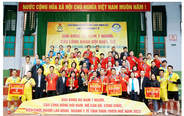
TTYT Hương Thủy: Giải nhất đồng đội nam, nữ cầu lông